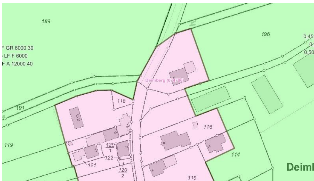
Abb. 1: Auszug aus der Bodenrichtwertkarte für den Stichtag 01.01.2022 vor der Berichtigung

In der Gemarkung Deimberg (4706) im Landkreis Kusel, Bodenrichtwertzone 0210 (baureifes Land, erschließungsbeitragsfrei, Mischgebiet, offene Bauweise, zweigeschossig, Größe des Richtwertgrundstücks 700 m 2 ), ist es zu einem Übertragungsfehler gekommen. Laut Beschluss des Gutachterausschusses für den Stichtag 01.01.2022 und den Stichtag 01.01.2024 muss der vordere Teil des Flurstückes 196 (An der Steinreiß 10), sowie Teile der Flurstücke 185, 117/1 und 198 (Straßenflurstücke) innerhalb der Bodenrichtwertzonen für Land- und Forstwirtschaft 7021 (Forstwirtschaft, Größe des Richtwertgrundstücks 6000 m 2 ), 8021 (Grünland, Größe des Richtwertgrundstücks 6000 m 2 , Wertzahl 39) und 9021 (Bodenrichtwert Fläche Größe des Richtwertgrundstücks 12000 m 2 , Wertzahl 40) liegen.